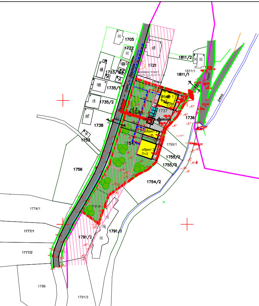
НУМЕРИЧКИ ПОКАЗАТЕЛИ за градбите во парцелата